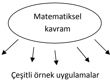
Şekil 1. A tipi uygulama problemi

İkinci tür problemlerde tasvir edilen durumlar öğrencilerin kendi deneyimlerine benzer olmalı ve problem öğrenciler tarafından ilginç ve çözülmeye değer bulunmalıdır. Bu problemlerin çözümünde çoğunlukla birden fazla matematiksel kavram ve beceri işe koşulabilir ve böyle olması da tercih edilmelidir.